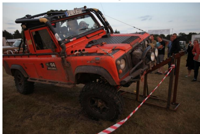
Det er en tysker!!