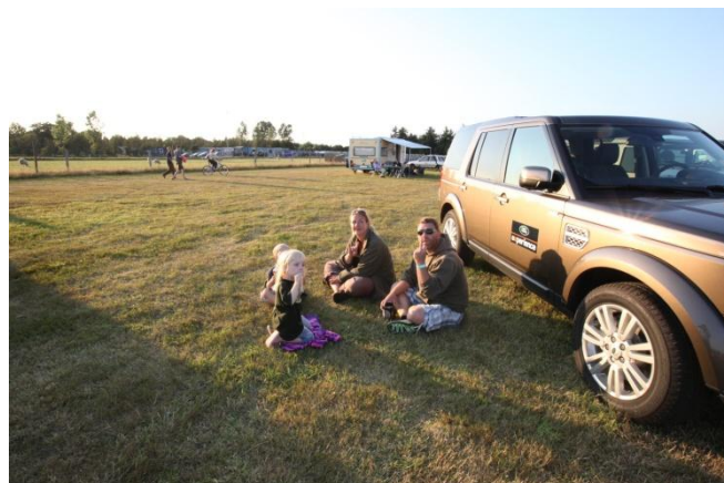
Klæder bilen os?