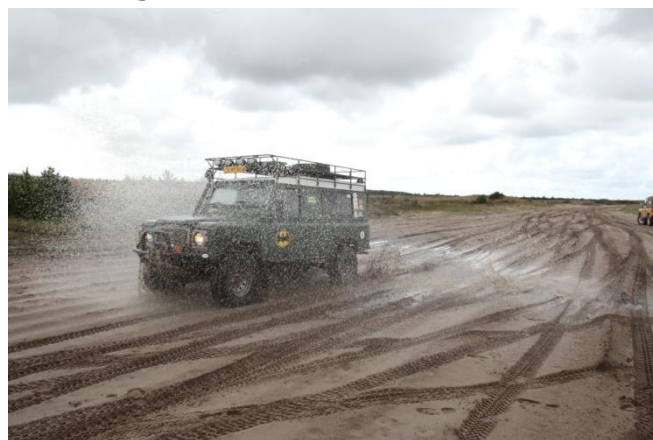
Ups en vandpyt