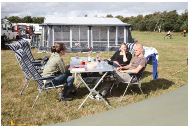
Hygge på campen