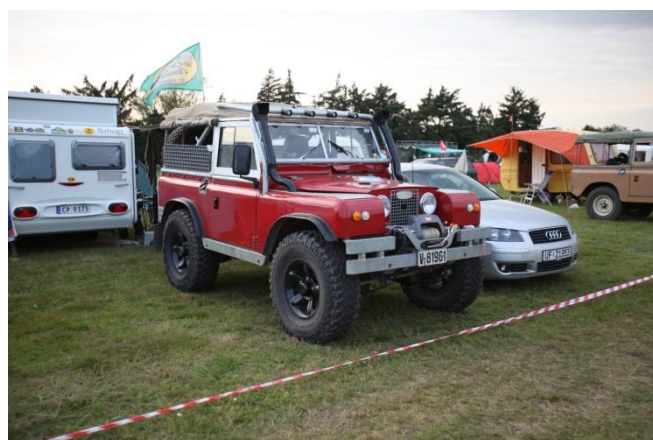
Veteranracer fra Norge