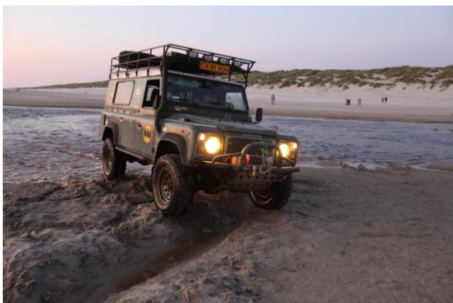
Leg på stranden